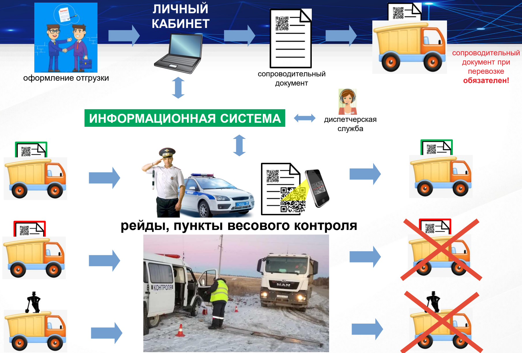
Схема работы ИС «Ресурс-Контроль»